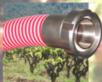
Tuyau Vini Paciphae® et raccord sertis