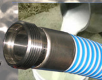
Tuyau Paciphae Lait® et raccord sertis